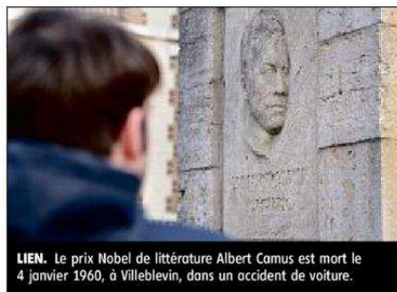
LIEN. Le prix Nobel de littérature Albert Camus est mort le 4 janvier 1960, à Villeblevin, dans un accident de voiture.

Il y a un peu plus de 60 ans, le 4 janvier 1960, l'écrivain Albert Camus perdait la vie dans un accident de voiture, à Villeblevin.