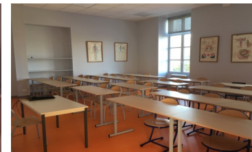
Salle de cours