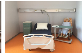
Salle de TP