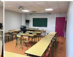
Salle de cours