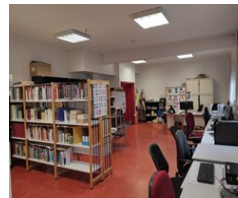
Centre de documentation