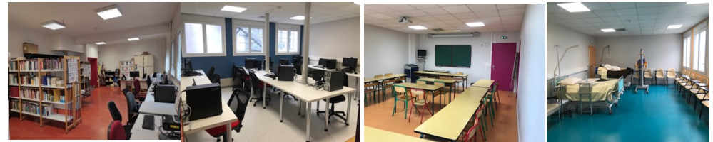
Centre de documentation